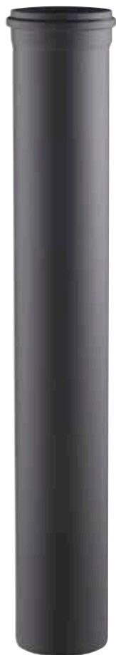
ELEMENTO LINEARE H=2000 LINEAR ELEMENT H=2000