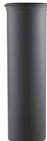
ELEMENTO LINEARE H=500 LINEAR ELEMENT H=500