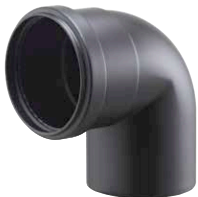
CURVA 90° MASCHIO/FEMMINA 90° BEND, MALE/FEMALE