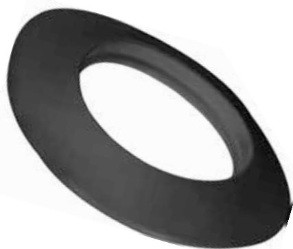
ROSONE IN SILICONE SILICONE ROSETTE