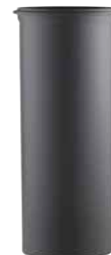
ELEMENTO LINEARE H=250 LINEAR ELEMENT H=250