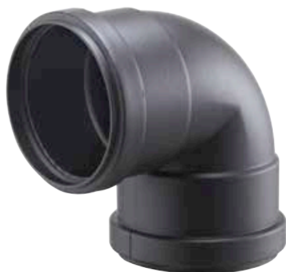
CURVA 90° FEMMINA/FEMMINA 90° BEND, FEMALE/FEMALE