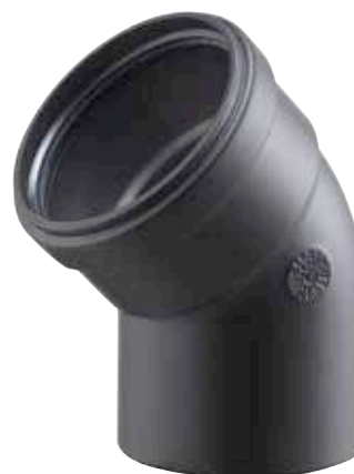
CURVA 45° MASCHIO/FEMMINA 45° BEND, MALE/FEMALE