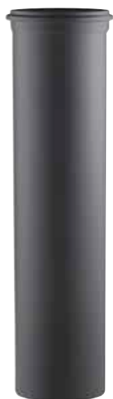
ELEMENTO LINEARE H=1000 LINEAR ELEMENT H=1000