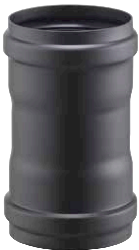
MANICOTTO FEMMINA/FEMMINA FEMALE/FEMALE SLEEVE