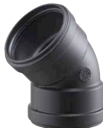
CURVA 45° FEMMINA/FEMMINA 45° BEND, FEMALE/FEMALE